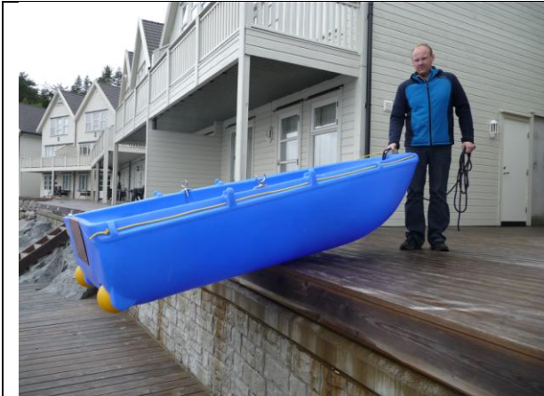
Trill jollen frem hit og hold tauet slik at du kan legge jollen nedover / dra oppover.