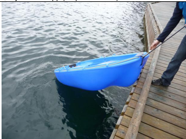
Legg forsiktig jollen nedover/dra oppover.