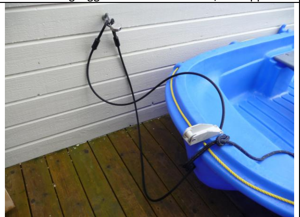
Wirelås og fest til jollen.