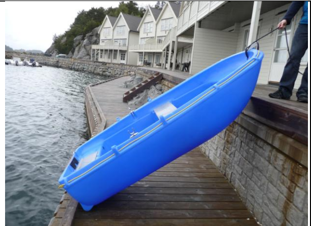
Her stopper jollen ved kanten. Gå ned og se neste bilde.