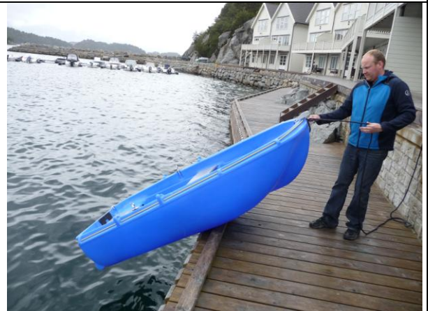
Hold tauet og legg båten sakte nedover / dra opp.