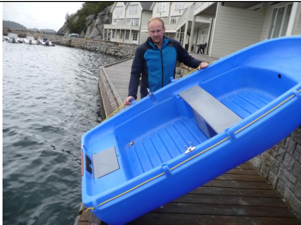
Løft jollen litt opp (en på hver side) over kanten.